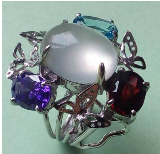
珠寶銀飾代表作品

藉由社大交流平台,推廣專業的珠寶設計藝能為生活化、平民化不再是富人專享，培養學員備第二專長，促進社區產業經濟化，期許大家能一起努力提升社區素養。